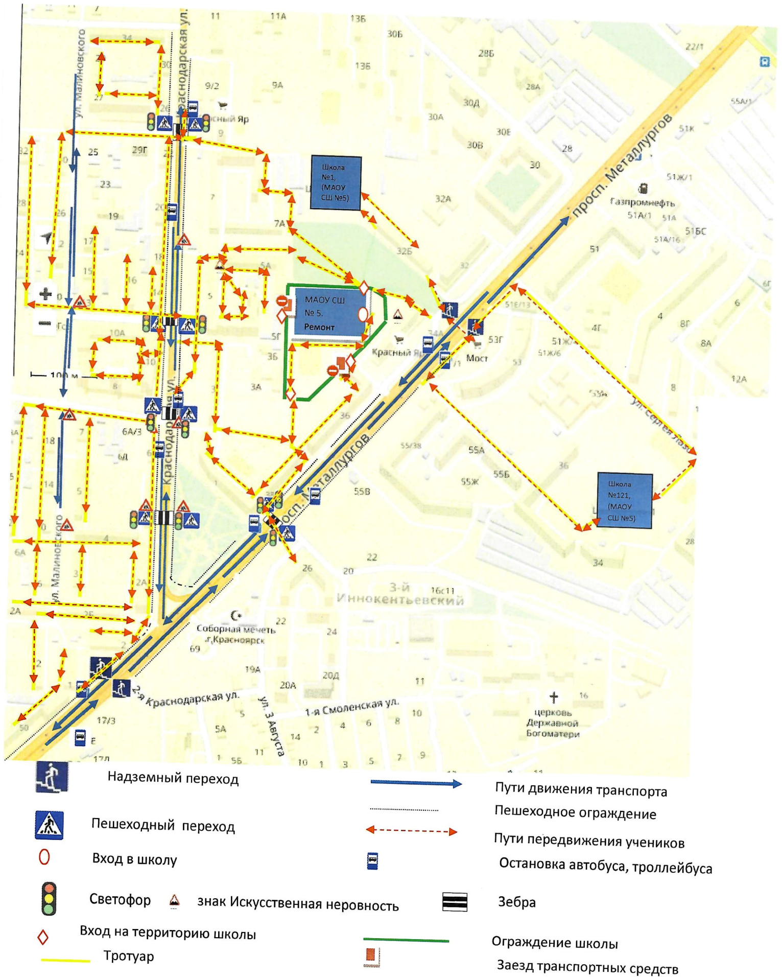
Схема1. План-схема района расположения ОУ, пути движения транспортных средств и детей (учеников)