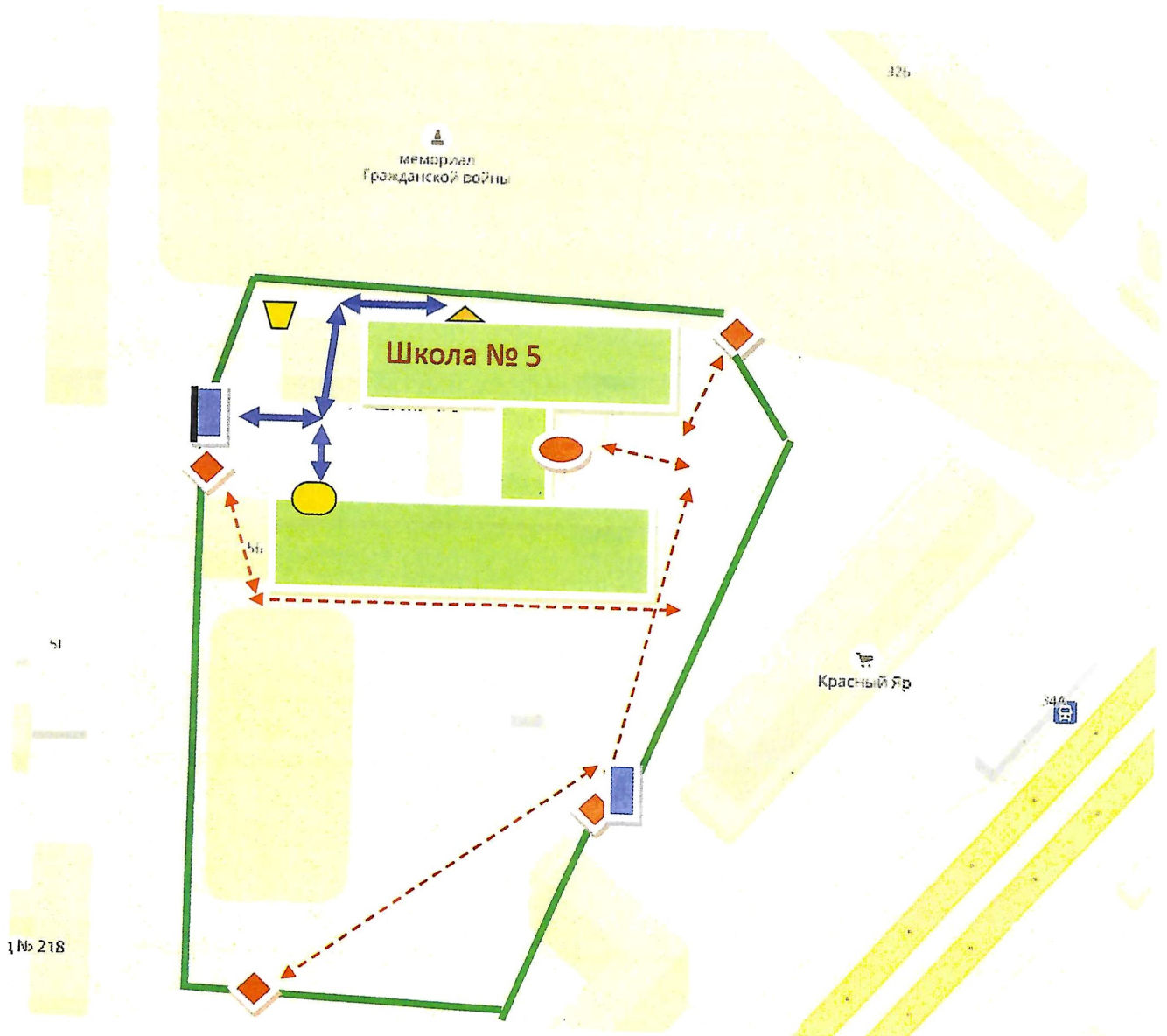
Схема 3. Пути движения грузовых транспортных средств к местам разгрузки/погрузки и рекомендуемые пути передвижения детей по территории образовательного учреждения